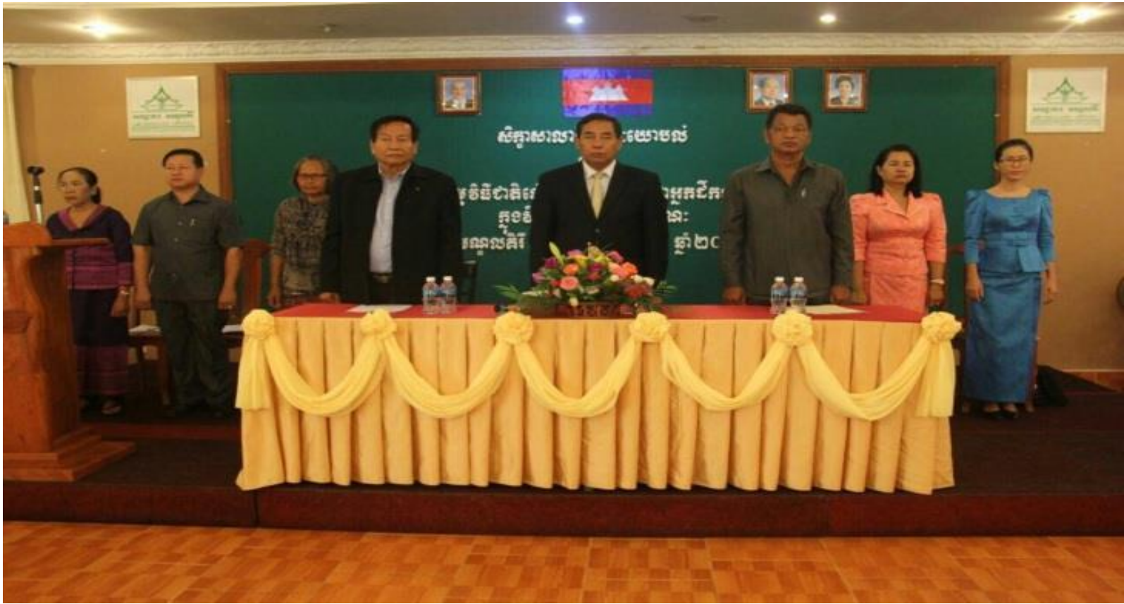
សកម្មភាពរៀបចំសិក្ខាសាលាគ្រោះយោបល់ស្តីពីកម្មវិធីជាតិលើកកម្ពស់ស្រ្តីភាពជាអ្នកដឹកនាំ ក្នុងវិស័យមុខងារសាធារណៈ ឆ្នាំ២០១៨-២០២៣ នៅខេត្តមណ្ឌលគិរី នាថ្ងៃទី០៦ ខែវិច្ឆិកា ឆ្នាំ២០១៧