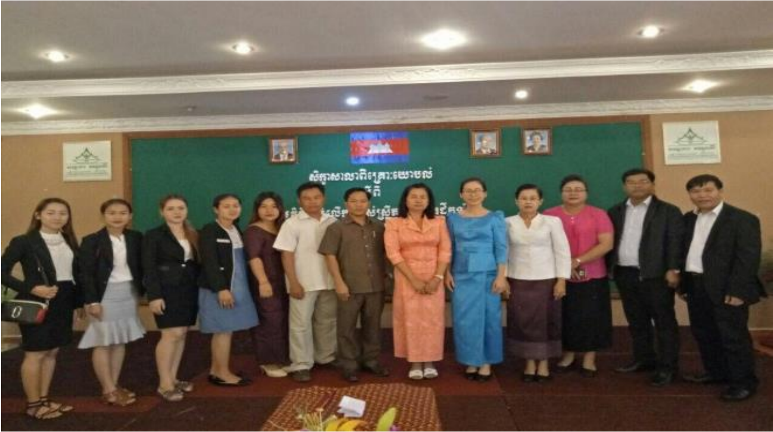
សកម្មភាពរៀបចំសិក្ខាសាលាពិគ្រោះយោបល់ស្តីពីកម្មវិធីជាតិលើកកម្ពស់ស្រ្តីភាពជាអ្នកដឹកនាំ ក្នុងវិស័យមុខងារសាធារណៈ ឆ្នាំ២០១៨-២០២៣ នៅខេត្តមណ្ឌលគិរី នាថ្ងៃទី០៦ ខែវិច្ឆិកា ឆ្នាំ២០១៧